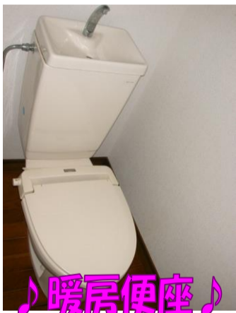
♪ 暖房便座 ♪