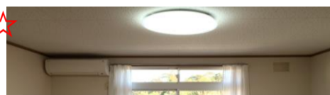
シーリングライト (LEDタイプ) 設置部屋有