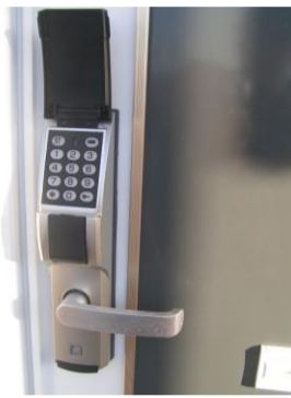
電子ロックキー付 部屋有